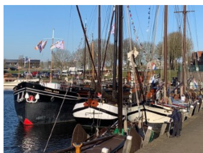
Tjalkendag in Vollenhoven 19 april.

Alhoewel ... De nieuwjaarsreceptie durfden we nog niet aan, maar de Tjalkendag in Vollenhoven, die al een paar jaar op de agenda stond, kon eindelijk plaats vinden. We zijn daar met een paar gasten heen gevaren.