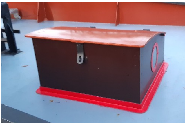
De nieuwe ingang op het mastdek gefinancierd met donateursgelden.

Voor 2023 hebben we besloten, gezien de inflatie, om de minimum bijdrage te verhogen van € 20,- naar € 22,50. Een hogere bijdrage is natuurlijk van harte welkom. Uw donatie graag overmaken op bankrekeningnummer NL69 INGB 0677 1757 60 t.n.v. Stichting Terra Nova.