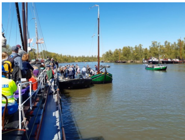
In de Biesbosch werden bezoekers aan- en afgevoerd.

Vanuit Arkel zijn we direct doorgevaren naar de Bosch Parade. Over de Dommel in Den Bosch varen drijvende