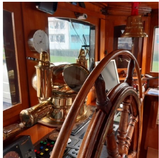
Originele kompas, stuurwiel en bel in de stuurhut.

De handen moesten flink uit de mouwen bij het leegruimen van het voorruim. Dit ter voorbereiding op het daar onder de buikdenning in februari schoonmaken door Clean B.V. in Werkendam.