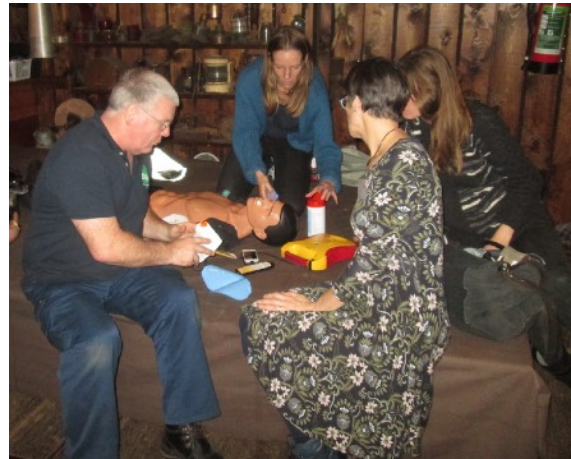
Een blote man op de Stuurvrouwendag: reanimatie gegeven door DGS.