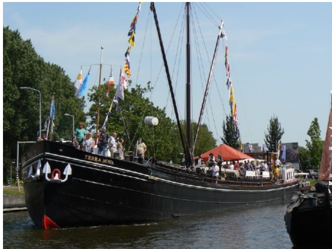
Spic en span vaart de Terra Nova Alkmaar binnen voor de Victorie Sail Alkmaar.

Voor dit jaar staan het afmaken van de spudpalen, een nieuwe bescherming voor het dak van de stuurhut en een zonnetent boven het voorste gedeelte van het zonnedeck gepland.