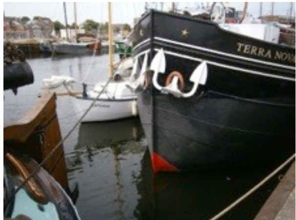
Terra Nova in Vlissingen, LVBHB reünie 2013

De jaarlijkse LVBHB reünie was dit jaar in Middelburg en Vlissingen van 26 t/m 28 juli. Op weg naar Middelburg voer een aantal betalende gasten mee, wat heel gezellig was. Vlissingen was aansluitend het startpunt van de reis door België. Dit was werkelijk wel het hoogtepunt van het jaar. We hadden fantastisch weer, een gezellige club mensen en een rustig vaarschema. Al met al een heel erg geslaagde reis.