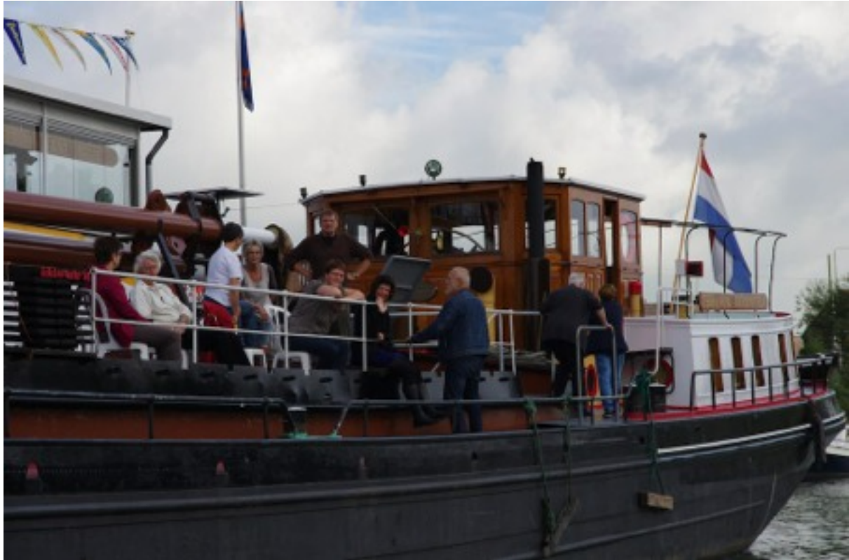
Donateursdag 2013 in Dordrecht