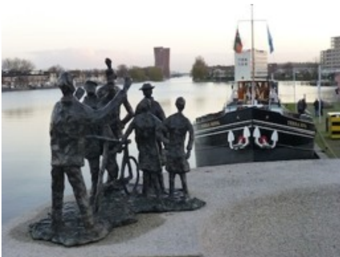
Terra Nova in Zaandam voor de LVBHB werkgroependag

Omdat we niet langer met meer dan twaalf gasten mogen varen moesten we op zoek naar een andere formule. Dit jaar lag de Terra Nova langs zij de René Siegfried, het onderkomen van de Vereniging De Binnenvaart. Het Binnenvaartmuseum was gratis te bezoeken en iets verderop lag De Ark, die ook te bezichtigen was.