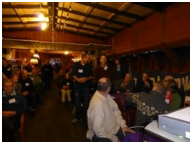
LVBHB werkgroependag a/b Terra Nova

Dit jaar is heel veel aan het uiterlijk van het schip gedaan. Het duurde vrij lang voordat de buitentemperatuur zo was, dat er geschilderd kon worden. De zomer was heel mooi en daardoor hebben we een flinke stap kunnen zetten voor wat het schilderwerk betreft, waardoor het zelfs anderen opvalt dat de Terra Nova er goed uit ziet.